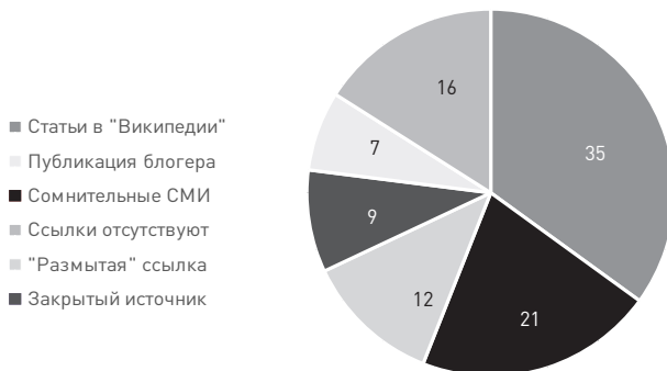
Диаграмма 2. Типы опорных источников, используемых фейковыми аккаунтами для подкрепления информации в разрезе 100 аккаунтов (усреднённое значение)

С другой стороны, специфика текущих информационных операций против РФ требует дополнительного осмысления. В первую очередь речь о факторе вмешательства медиакорпораций. Ограничение работы площадок экосистемы Meta 52* ( Facebook, Instagram ), с одной стороны, позволило несколько ослабить негативное влияние и стабилизировать информационный фон, а с другой – исключило возможность скоординированной информационной «контратаки» на упомянутых платформах. Аналогичным образом ситуация может сложиться и в случае с видеохостингом YouTube , разговоры о блокировке которого в последнее время ведутся всё чаще. Кроме того, определённой оценки уже в краткосрочной перспективе потребует проблема борьбы с искажением данных в интернет-энциклопедиях (в первую очередь в Wikipedia как наиболее посещаемом ресурсе).